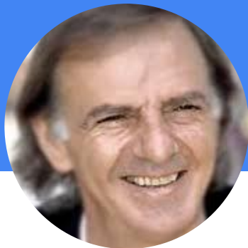
César Luis Menotti

Impulsor del Club Villas Unidas y Fundador de la Escuela Oficial de Entrenadores que lleva su nombre